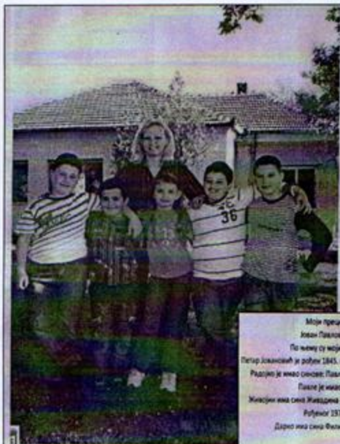
ОСНОВНА ШКОЛА "БЛАЖИНА САНЂА - ЈАК" - БАРУБОЈАЦ