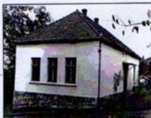
Школа у Малом Шиљеговцу – некада и сада